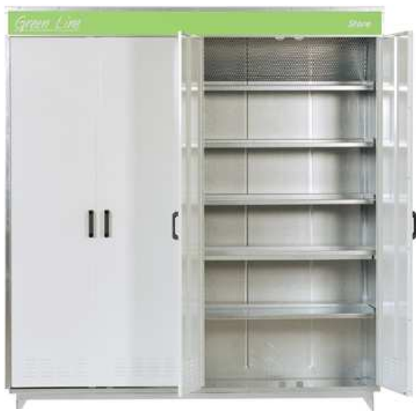
Bilden ovan visar en Store 195 (2-7195S).